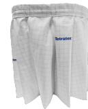
PTFE ANT Antistatischer PTFE Filter (M Klasse EN 60335-2-69)