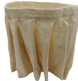
NOMEX Filtermaterial für hohe Temperaturen bis 250° Celsius