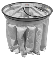
PSC Halbautomatischer pneumatischer Filtrerrüttler