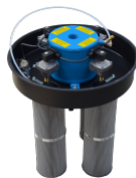
SP Druckluftabreinigung Antistatischer M Klasse Filter (EN 60335-2-69), 4 Polyester Filterpatrone, 12 m 2 Filterfläche