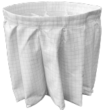
ANT M Antistatischer Filter (M Klasse EN 60335-2-69)