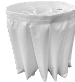
PTFE PTFE Filter (M Klasse EN 60335-2-69)